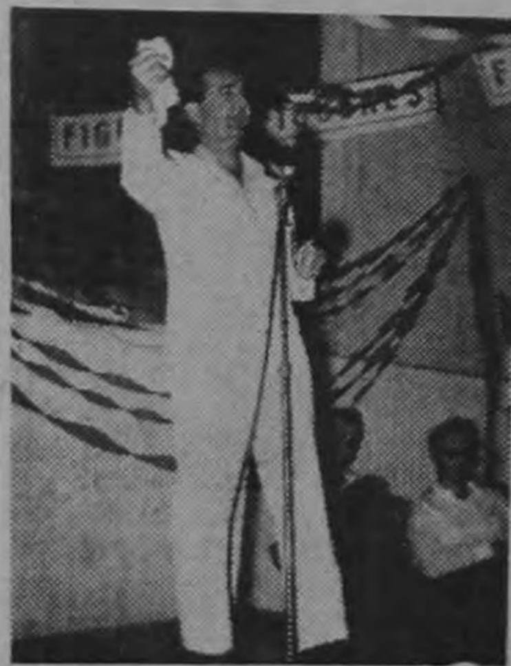
El caudillo José Figueres en su discurso de Siquirres, dijo: Todos los que quieren gobierno honesto y dispuesto a propiciar un mejoramiento económico social del país, tienen cabida en el Partido Liberación Nacional.