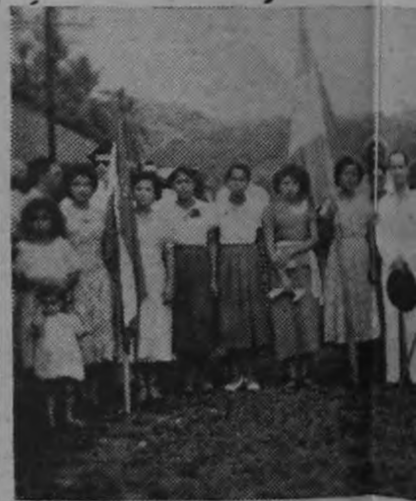
El Comité femenino de Siquirres, posa con el caudillo. Las señoritas estaban vestidas con el color de nuestra bandera.