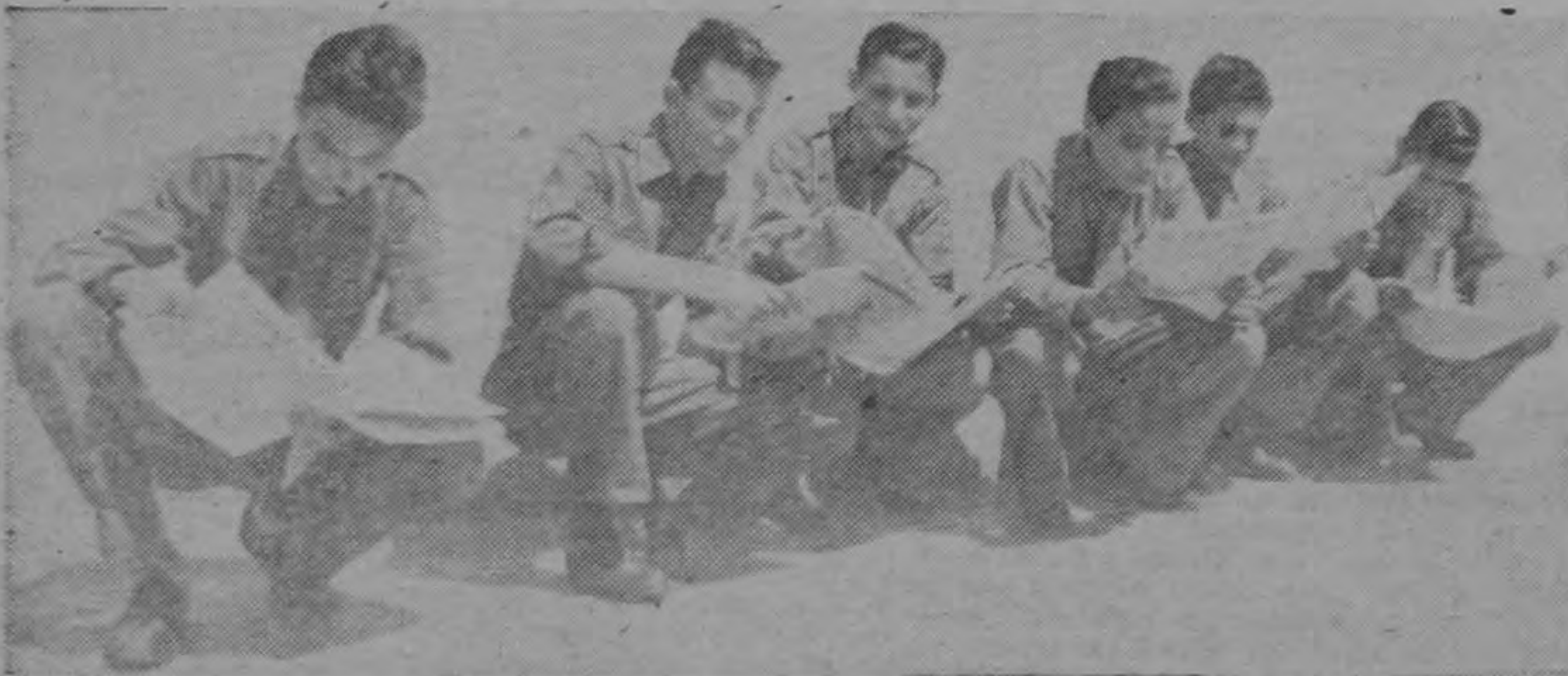
Aluneros del Colegio Los Angeles, concentrados en la lectura del órgano del Colegio, "La Voz del Estudiante". A falta de asientos, de cuclillas los estudiantes leen con avidez el último número de periódico, cuya salida, cada mes, constituye un verdadero suceso.