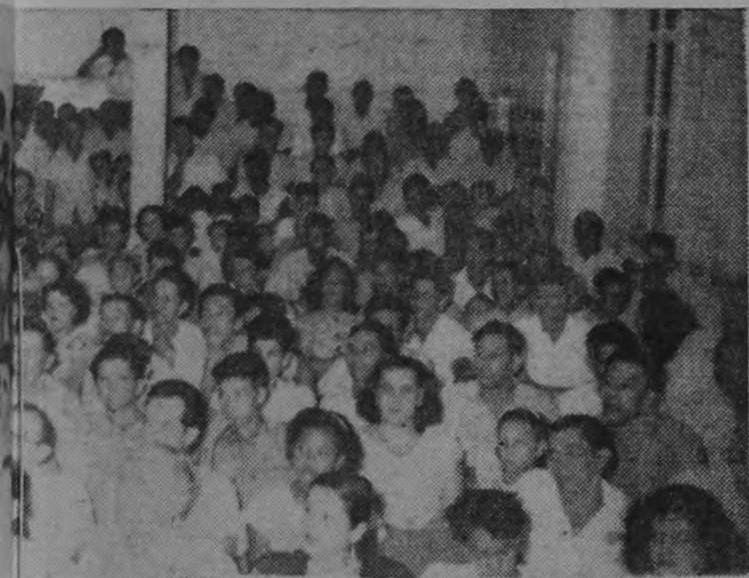
Teatro de la localidad para escuchar la pa