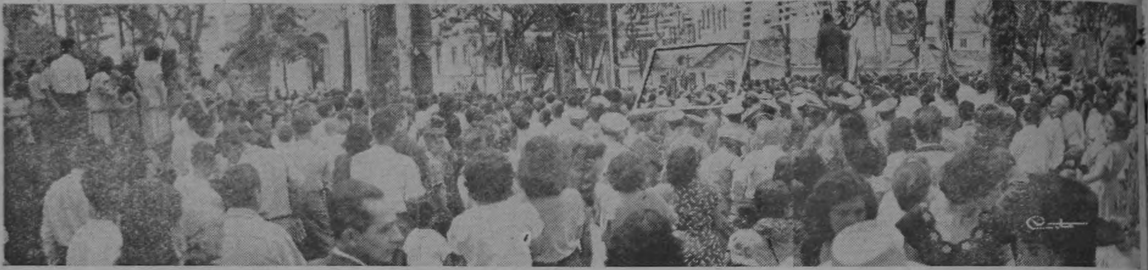
En la mañana del domingo Heredia rindió caluroso homenaje a don Manuel María Gutiérrez, autor de la música del Himno Nacional. El Ministro de Educación y el Gobernador de la Provincia presidieron los actos, conmemorativos del centenario de la creación del Himno.