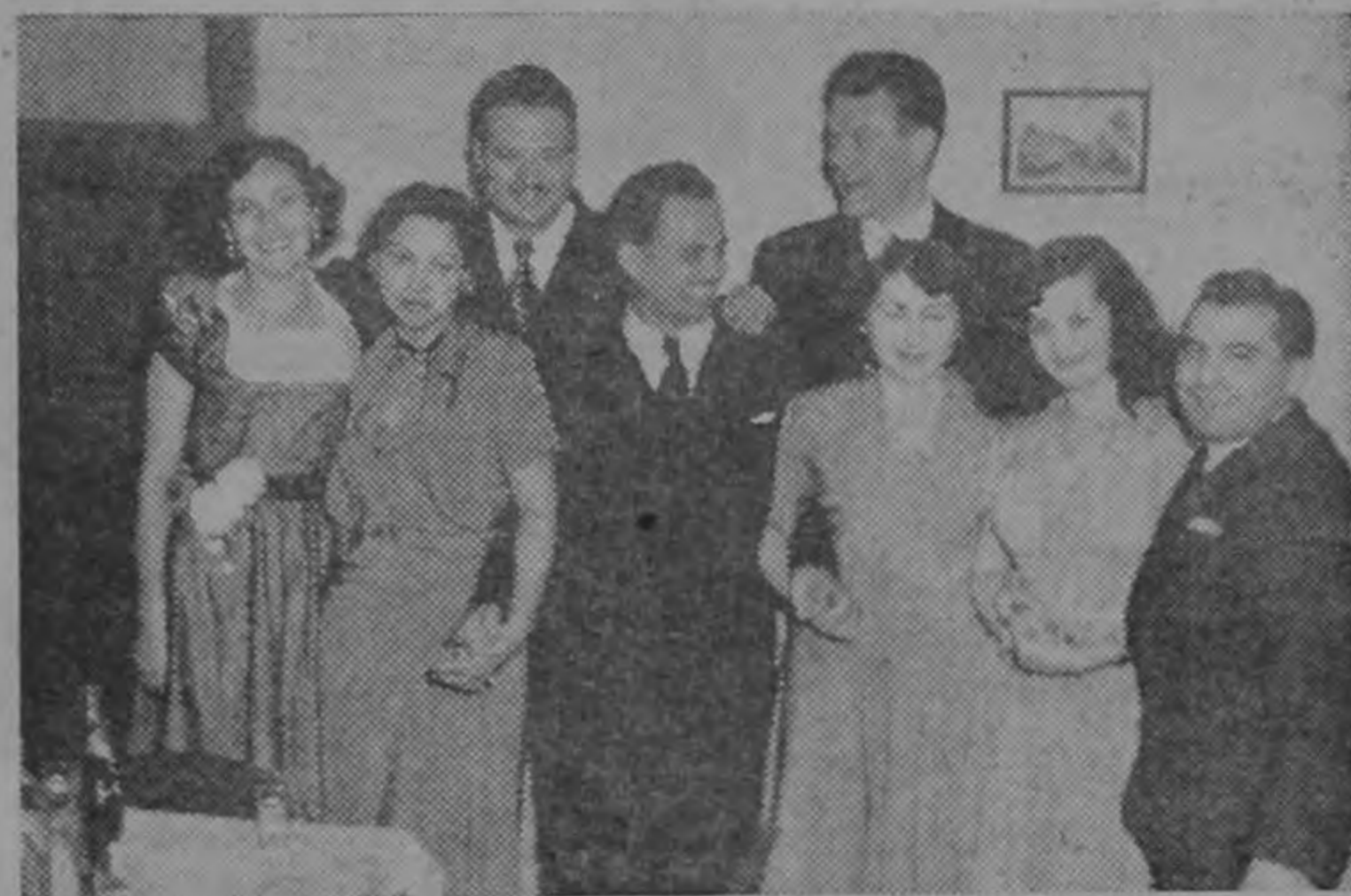
Alegria es el tema unánime, captado por la cámara de Carrillo en diversos actos sociales del sábado y el domingo