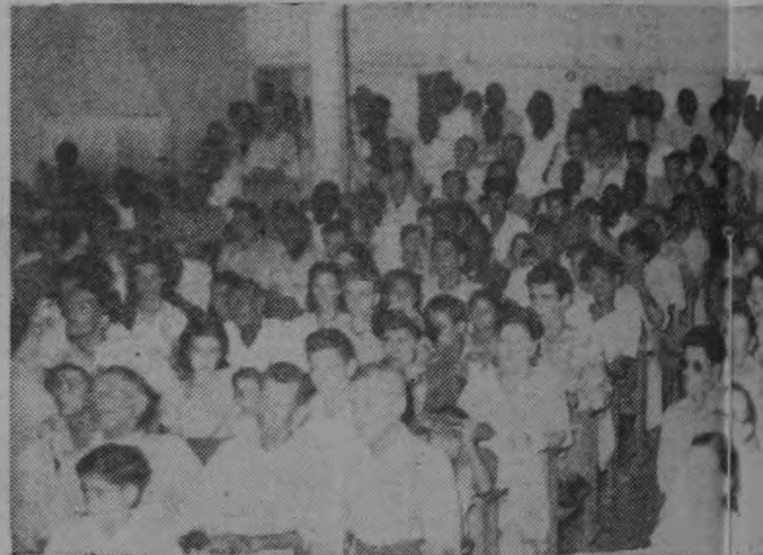
Los vecinos de Siquirres se congregaron en el Teatro para oír la palabra de Figueres..

Después, hablando en inglés, se dirigió al numeroso auditorio de gentes de color, manifestándoles que ellos habían dado su contribución al país, abriendo la zona bananera. Que era indispen-