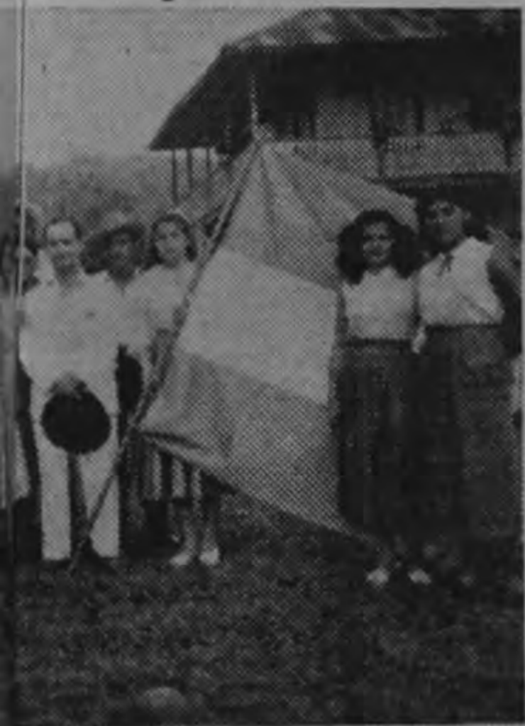
recepción en Siqui... Las estimables se... s con el verde y blan....